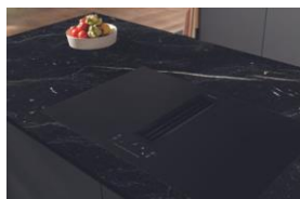
Immagine 3: Il potente piano cottura a induzione con MattFinish (KM 7576 FL) si integra con un'eleganza intramontabile in cucine di alta qualità. La superficie è particolarmente resistente ai graffi e facile da pulire. (Immagine: Miele)

Immagine 2: L'apprezzato piano cottura a induzione TwoInOne con cappa aspirante integrata è ora disponibile in una nuova versione (KMDA 7876 FL) con MattFinish. Elegante alla vista e al tatto, è resistente ai graffi e ha un effetto anti-impronta. (Immagine: Miele)