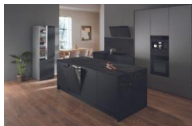
Immagine 1: Miele presenta ora la serie ArtLine senza maniglie, nonché i piani cottura a induzione e le cappe aspiranti in un elegante nero ossidiana opaco. Il nuovo colore è elegante e senza tempo e può essere abbinato a quasi tutti gli stili abitativi, a vari materiali e a molti colori.