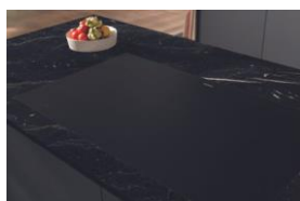
Immagine 2: L'apprezzato piano cottura a induzione TwoInOne con cappa aspirante integrata è ora disponibile in una nuova versione (KMDA 7876 FL) con MattFinish. Elegante alla vista e al tatto, è resistente ai graffi e ha un effetto anti-impronta. (Immagine: Miele)

Immagine 1: Miele presenta ora la serie ArtLine senza maniglie, nonché i piani cottura a induzione e le cappe aspiranti in un elegante nero ossidiana opaco. Il nuovo colore è elegante e senza tempo e può essere abbinato a quasi tutti gli stili abitativi, a vari materiali e a molti colori. (Immagine: Miele)